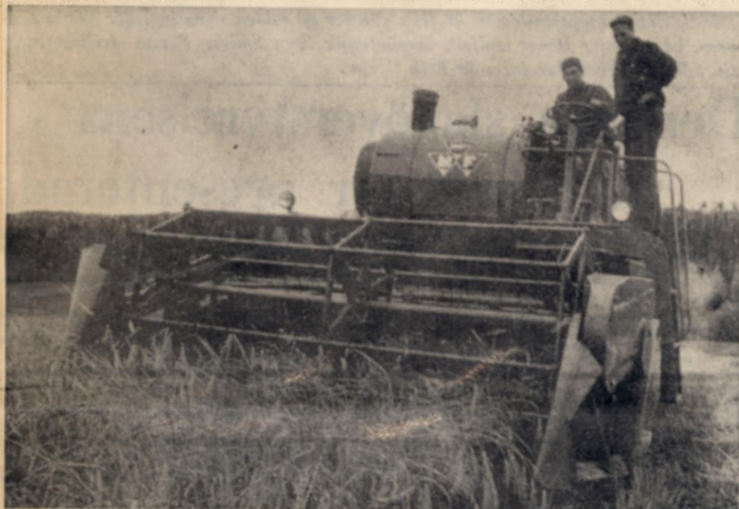
Den nya tiofots tröskan i arbete med Sune Berggren vid ratten.