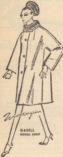
GASELL MODELL DEBUT